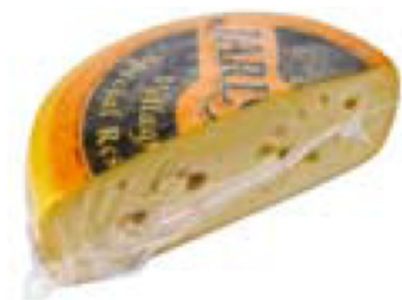
Eksporten av ost støttes med om lag 50 kroner per kilo.